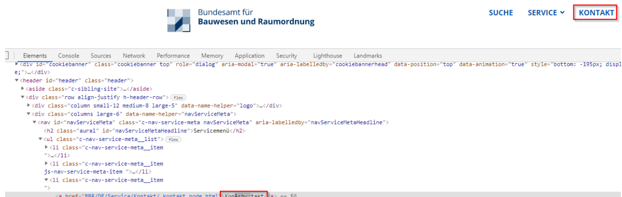
Abbildung 2 Startseite

Alles Webseiten: Auf den Seiten befinden sich &shy Zeichen in einzelnen Wörtern. Für ScreenReader Benutzer wird diese Zeichen vorgelesen und kann zu Verwirrung führen. Wortumbrüche am besten über CSS umsetzen. (Abb.02)