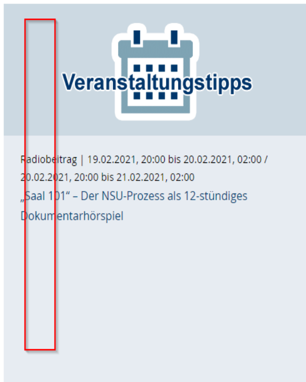
Abbildung 8 Jede Webseite