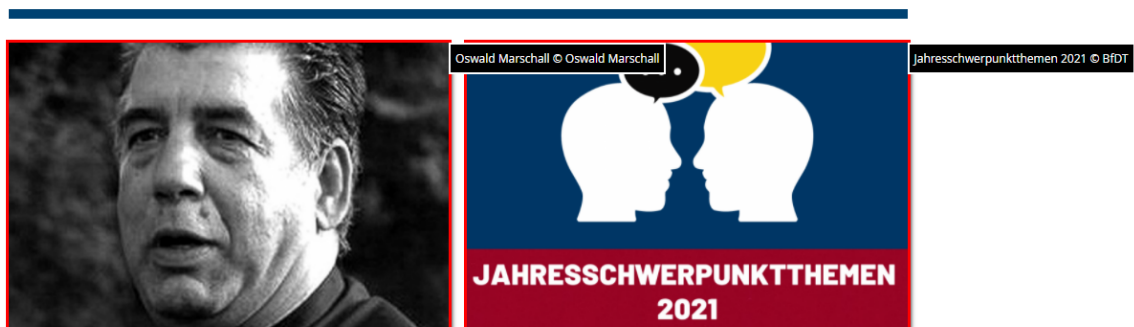
Abbildung 1 Startseite