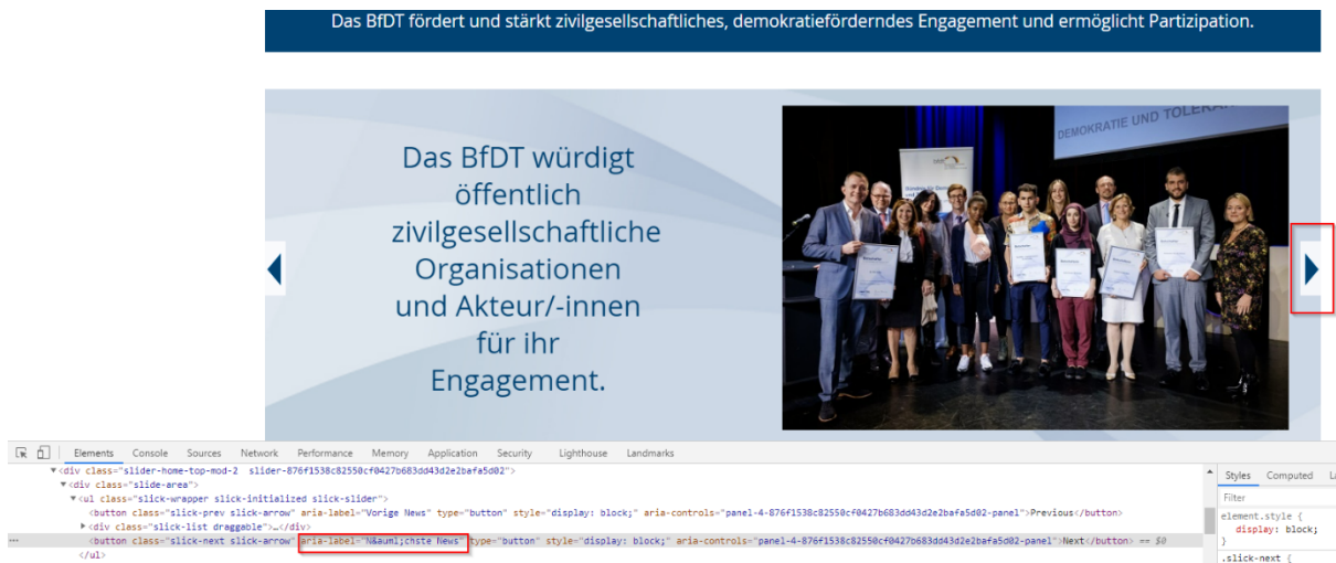
Abbildung 9 Startseite

Standard/Suche: Das Word „Suche“ ist als value eingebaut und kann zu Fehlereingabe mit Tastatur oder Screenreader führen. Besser wäre mit „Placeholder“ oder „aria-label Suche“ zu arbeiten. (Abb.11)