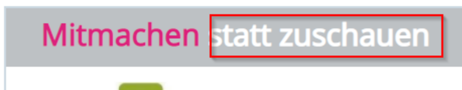
Abbildung 6 Startseite

Jede Webseite: Kontrastverhältnis ist 1,8:1 – Weiße Schrift auf grauem Hintergrund. Für große Schriften muss ein Kontrastverhältnis von 3:1 bestehen.