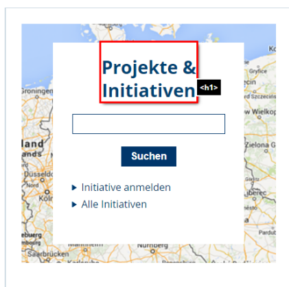
Abbildung 5 Kontakt und Suchergebnisse