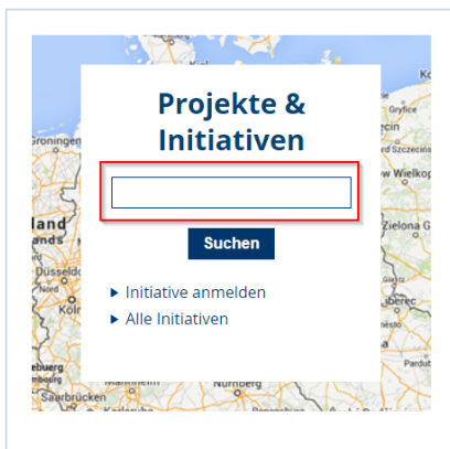
Abbildung 10 Kontakt