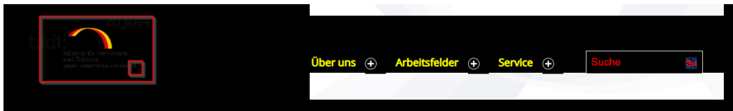
Abbildung 7 Startseite Kontrasteinstellung