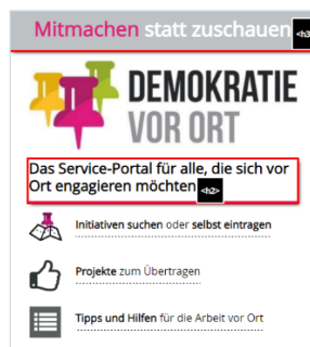
Abbildung 4 Startseite

Startseite Fehldarstellung bei Kontrastanpassung: transparente Grafik nicht zu erkennen. (oben links) (Abb. 07)