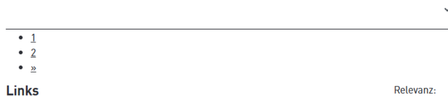
Abbildung 2 Suche Ausklappliste

Suche: Die darunterliegende Liste für die Anzeige der Paginierungen, hat keine Beschreibung in dem Sinn, dass es sich hier um eine „Blätternavigation“ handelt. (Abb. 02)